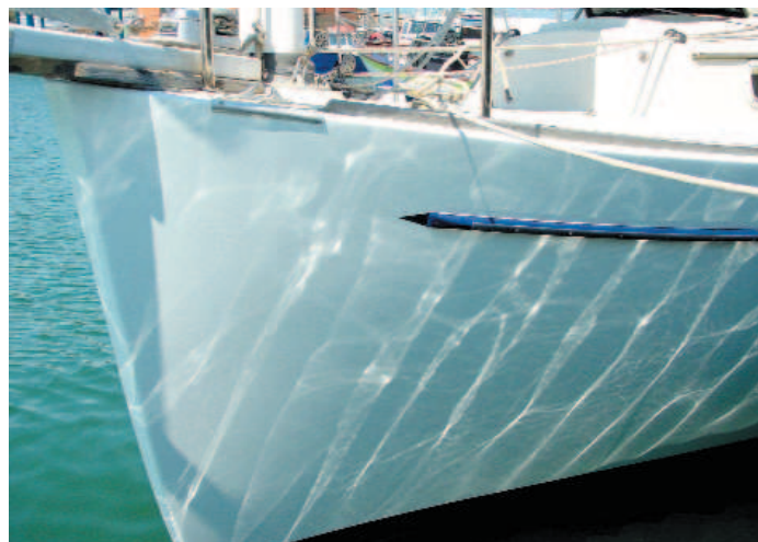
Il risultato finale e la barca in acqua; i riflessi di luce testimoniano la sua perfetta lucentezza

Nell'attesa la superficie da pitturare viene ancora una volta spolverata, meglio se usando il nostro panno antistatico, con una leggera pressione.