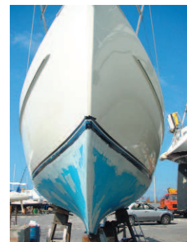
Le fiancate della barca tornano come nuove dopo l'applicazione dello smalto