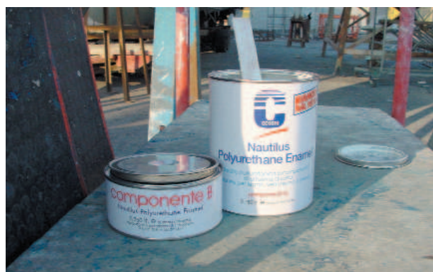
In alto, lo smalto Nautilus Polyurethane Enamel colore bianco nelle confezioni da 750 ml e 1,5 l e il diluente Nautilus Polyurethane Thinner