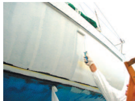
Applicazione a rullo dello smalto dopo il fondo di Epoxy Primer

Se poi gli armatori operano all'aperto, in rimessaggio o banchina lavorando a spruzzo si rischia di spargere il prodotto sulle altre barche o su auto in sosta nelle vicinanze creando danni agli altri.