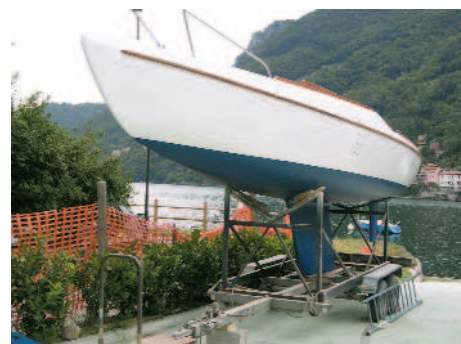
Alcune barche che hanno applicato lo smalto Nautilus Polyurethane Enamel a rullo